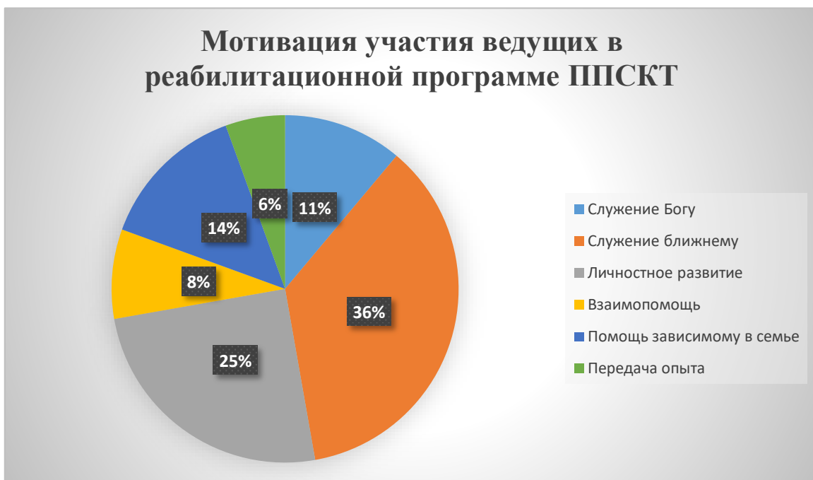
Рис. 1. Мотивация участия ведущих в реабилитационной программе ППСКТ.