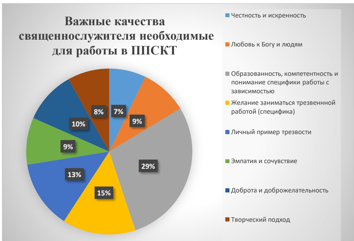
Рис. 8. Важные качества священнослужителя необходимые для работы в ППСКТ.