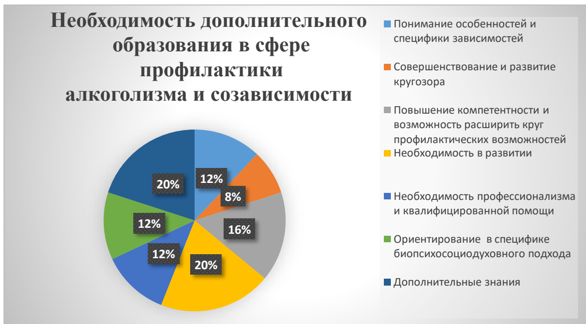
Рис. 5. Необходимость дополнительного образования в сфере профилактики алкоголизма и созависимости.