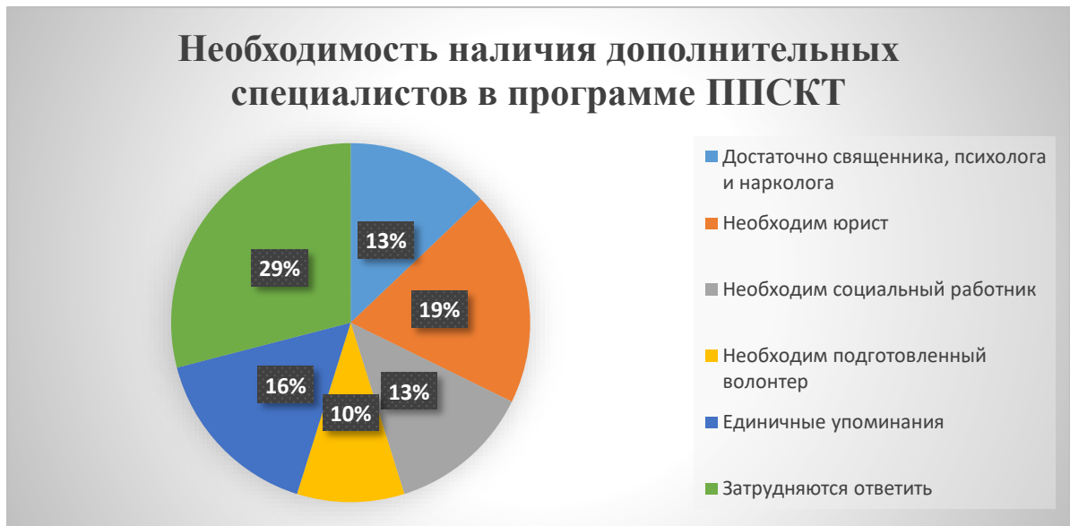
Рис. 7. Необходимость наличия дополнительных специалистов в программе ППСКТ.