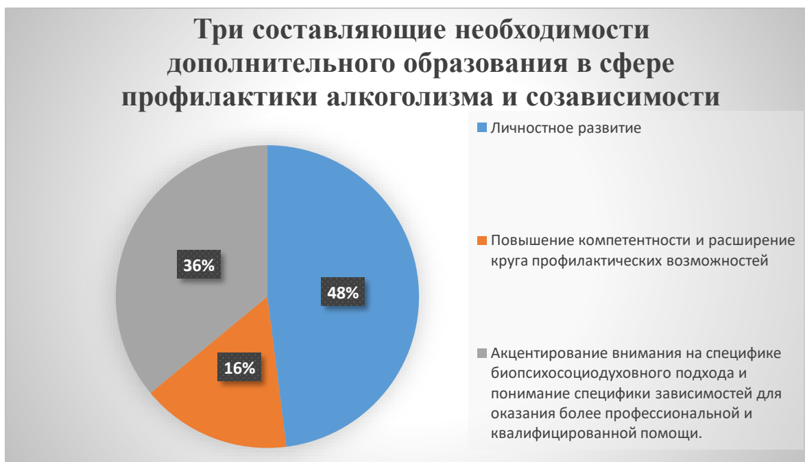
Рис. 6. Три составляющие необходимости дополнительного образования в сфере профилактики алкоголизма и созависимости.