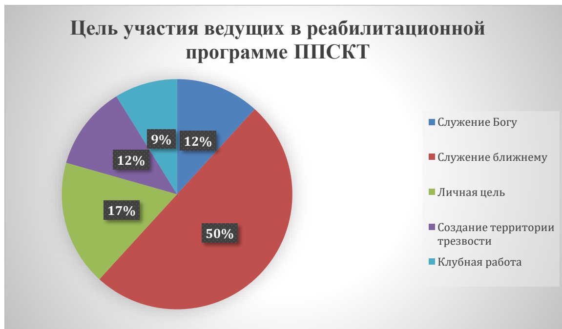
Рис. 2. Цель участия ведущих в реабилитационной программе ППСКТ.