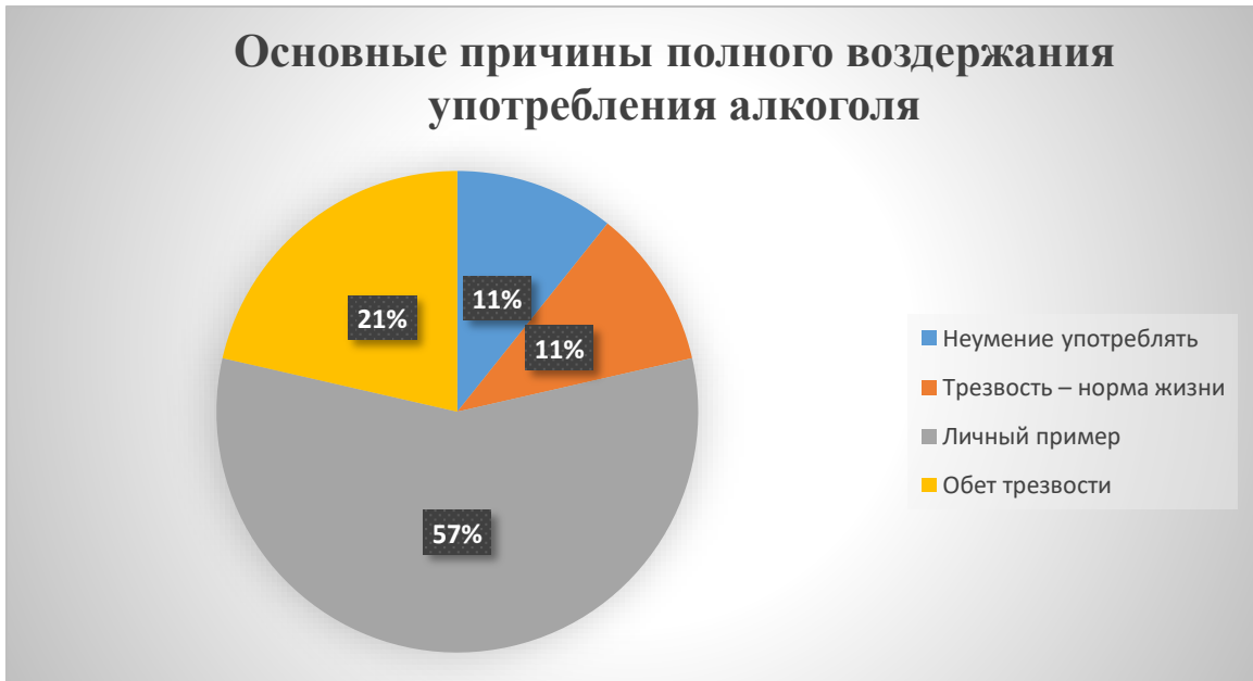
Рис. 4. Основные причины полного воздержания от употребления алкоголя.